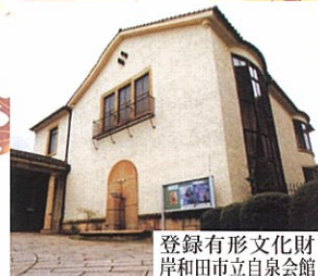
登録有形文化財 岸和田市立自泉会館

Kishiwada Castle Music Festival 秋の祭典 2015