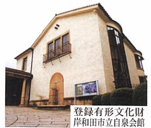
登録有形文化財 岸和田市立自泉会館