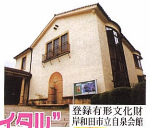
登録有形文化財 岸和田市立自泉会館

Kishiwada Castle Music Festival 夏の祭典 2015