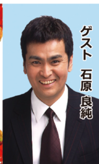
ゲスト 石原 良純