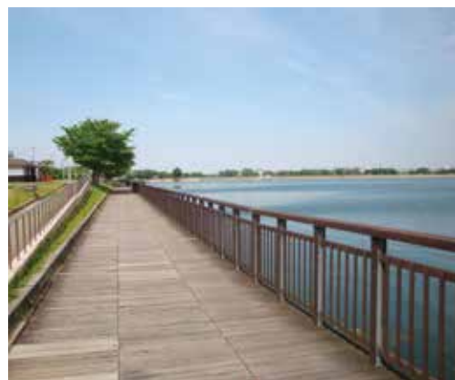
岸和田市「ここに残る景観資源発掘プロジェクト」 ここに残るみち景観