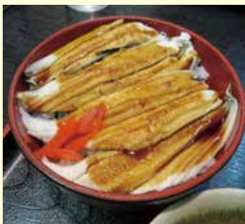
▲「漁師家 幸」の煮穴子丼（岸和田市地蔵浜町）

泉州地域広域観光連携協議会内に設置されたワーキングチーム（Ⅱ泉州地域の7商工会議所の中堅・若手職員7名で構成）が、泉州地域のサイクルルートの試走ならびに周辺施設の調査を行いました。 調査は北部班（Ⅱ堺・高石・泉大津・和泉）と南部班（Ⅱ岸和田・貝塚・泉佐野）に分かれて実施され、当所が所属する南部班では①岸和田市内の海浜地区、②貝塚市および泉佐野市内の海浜地区と両市内の丘陵地区、③岸和田・貝塚・泉佐野市内の丘陵地区を3日間に亘って調査しました。