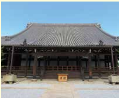
▲本堂、庫裏、鐘楼など江戸時代につくられた迦藍が今も残る「願泉寺」（貝塚市中）