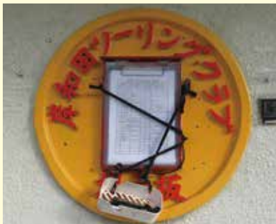
▲葛城山の山頂にある「岸和田ツーリングクラブ」の掲示板

今回の調査を通じて様々な施設でヒアリングを行ったところ、①泉州地域を目的地として来訪する観光客が少なく、②外国人の泉州地域に対する認知度が低い、という2つの意見が多く挙がりました。 この現状を把握したうえで、泉州地域を目的地として訪れる観光客（特に外国人）をどのように増加させるかという点に重点を置きながら、泉州ならではの地域資源を活用したサイクリングコースの提案などに努めてまいります。