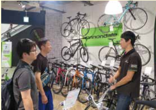
▲岸和田カンカンベイサイドモール内の自転車販売店「Rabbit Street」でヒアリングを行うワーキングチームメンバー