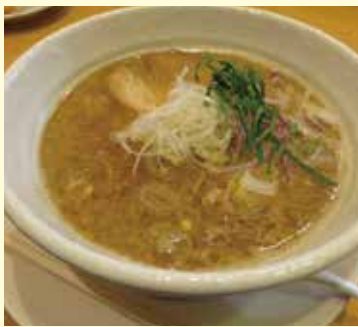
▲「麺屋 上々」の上々黒麺（泉佐野市上町）

泉州地域広域観光連携協議会内に設置されたワーキングチーム（Ⅱ泉州地域の7商工会議所の中堅・若手職員7名で構成）が、泉州地域のサイクルルートの試走ならびに周辺施設の調査を行いました。 調査は北部班（Ⅱ堺・高石・泉大津・和泉）と南部班（Ⅱ岸和田・貝塚・泉佐野）に分かれて実施され、当所が所属する南部班では①岸和田市内の海浜地区、②貝塚市および泉佐野市内の海浜地区と両市内の丘陵地区、③岸和田・貝塚・泉佐野市内の丘陵地区を3日間に亘って調査しました。