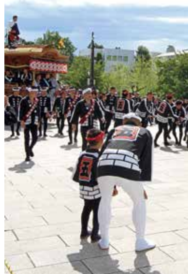
第25回きしわだの四季写真コンクール 総合部門・銅賞（岸和田市観光振興協会賞）