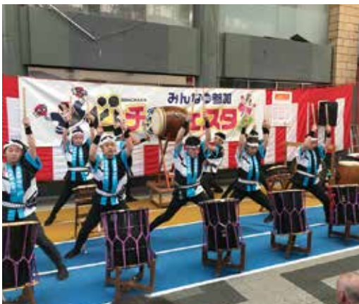
▲久米田高校太鼓部