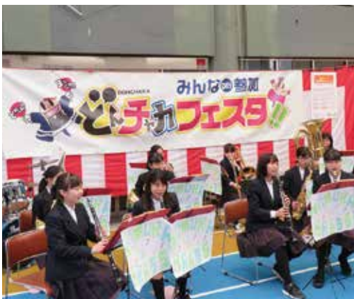
▲野村中学校 brassバンド部