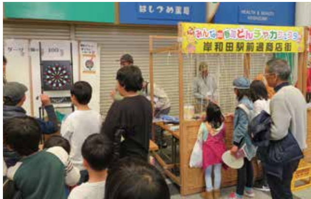
▲岸和田駅前通商店街のゲームコーナー

平成31年4月7日、南海岸和田駅周辺の商店街（岸和田駅前通商店街・寿栄広商店街・城見橋筋商店街・岸和田本通り商店街・かじやまち）では、岸和田TMO主催による春の「みんなDay参加！どんチャカフェスタ」が開催されました。 岸和田駅前通商店街に設置された特設ステージでは、プラスバンドやフォークソング演奏などの楽しいイベントが催され、ステージ周辺は大いに盛り上がりました。 また、岸和田駅前通商店街、かじやまちの特設会場では毎年大好評の「人形劇まちかどステージ」が開催され、たくさんの子供達が臨場感溢れる人形劇公演を楽しんでいました。 各商店街では、縁日出店、ゲームコーナー、フリーマーケットなど趣向をこらした独自のイベントが実施されたほか、大道芸人による「街なか大道芸フェスティバル」などが催され、商店街周辺は子供から大人まで多くの来街者で賑わいました。