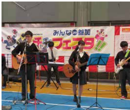
▲久米田高校フォークソング部