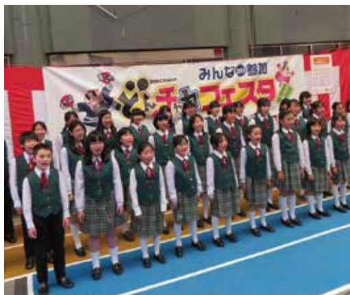
▲岸和田市少女合唱団