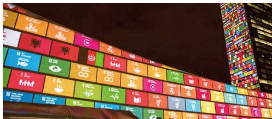
▲ SDGs が採択されたときに、国連の壁にプロジェクションマッピングで祝福した模様