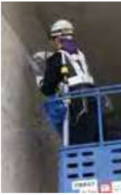
高所作業車を用いた高速道路の断面補修工事

「社員一人ひとりの人間力向上」をモットーに、全国各地にあるコンクリート構造物の補修・補強工事を行っています。創業から歴史は浅いものの、経験豊富な従業員が多数在籍しており、これまで培ってきた高い技術力を用いて、高品質の施工を短納期で行う事を可能にしています。 近年は、コンクリート構造物の老朽化に伴い、市場全体での工事件数は増加傾向にあります。コロナウイルスの影響により、新規取引先の獲得に向けた訪問営業や対面による施工内容の確認などが従来通り行えないケースもあるため、非対面型ビジネスモデルへの転換が急務となっています。