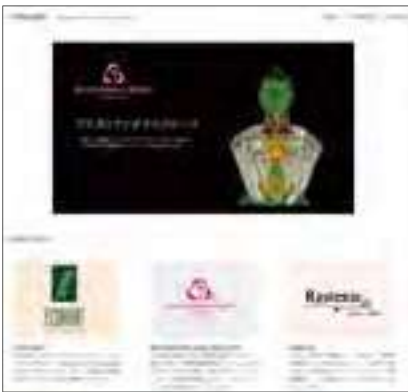
リニューアル後のトップページ。取り扱うブランドの一覧などがわかりやすく表示される。

「人と自然にやさしく」「自然と植物のエネルギーを実感できる本物」をテーマに、内側と外側の両面からの改善を目指し、快適な生活につながる本物の商品を取り揃えています。