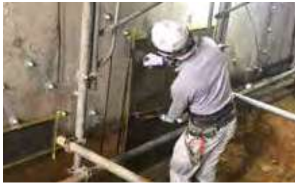
事前に外壁調査及び打診調査を行いコンクリートの剝離・剝落部や浮き部を確認後、劣化したコンクリートをはつきり除去し、状況に合わせた断面修復材にて断面の修復作業を行う。

今回は、持続化補助金を活用し、企業概要や事業内容、施工事例などをわかりやすく伝えることのできるホームページを開設。自社の特徴や強みを広くPRするとともに、サイト内に設けたお問い合わせフォームの活用などを通じて、新たな生活様式としての非対面型営業の強化にも取り組んでいます。