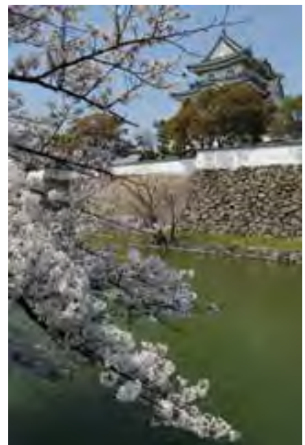
「岸和田城と桜」