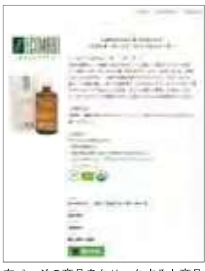
右ページの商品をクリックすると商品情報の詳細や金額などが表示される。

今回は、持続化補助金を活用し、自社オンラインショップのリニューアルを行い、ネット広告などを活用しながら対面型販売から非対面型ビジネスモデルへの転換による販路拡大に取り組んでいます。