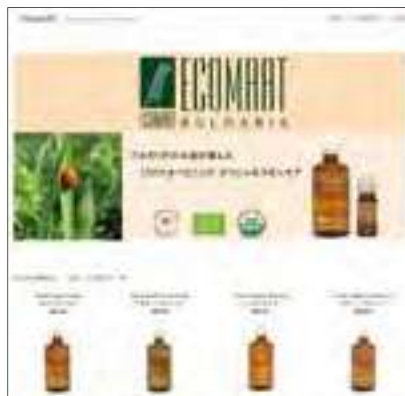
ECOMAT社製スキンケア商品の紹介ページ。