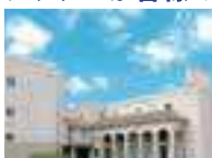
シティホール下松