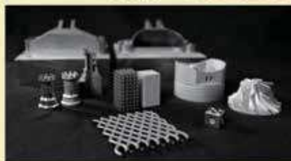
金属3Dプリンタにより作成した造形物

また、造形物の高機能化につながるトポロジー最適化や、造形不良を回避できる熱変形シミュレーションといった、実際の造形前に設計・解析できるソフトウェアも取り揃えています。