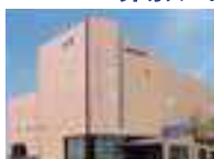
シティホール岸和田