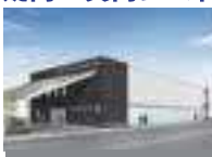
シティホール岸和田和泉