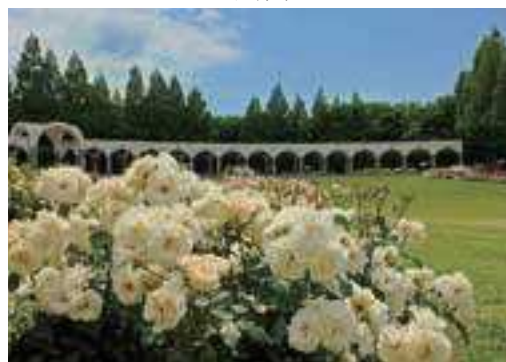
第22回きしわだの四季写真コンクール 総合部門・入賞