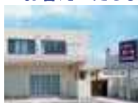
シティホール岸和田南館