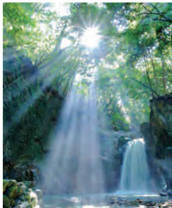
第25回きしわだの四季写真コンクール 総合部門・銀賞