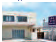
シティホール岸和田南館