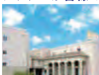
シティホール下松