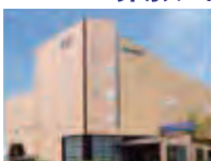
シティホール岸和田