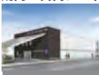
シティホール岸和田和泉