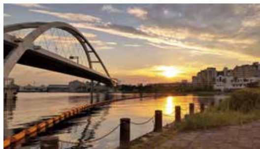
岸和田市「こころに残る景観資源発掘プロジェクト」 眺望景観