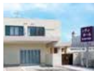
シティホール岸和田南館