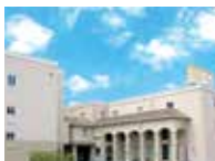
シティホール下松