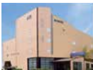
シティホール岸和田