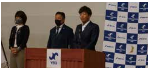
令和5年度 大阪府商工会議所青年部連合会