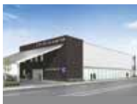
シティホール岸和田和泉