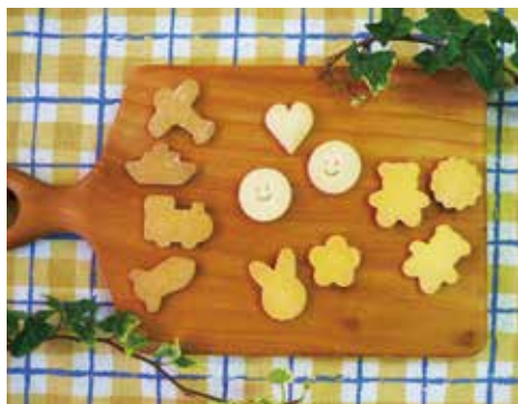
かわいい形が楽しいアレルギー対応のビスケット

ることで、自社ブランドの認知度向上を図ります。また、従来の子ども向け中心の商品構成から、贈答用や大人向けの高付加価値商品へと展開の幅を広げる方針です。さらに、自社サイトに加え大手ECモールへの参入も視野に入れ、販路の多様化を推進。岸和田から全国へと、その挑戦の歩みを一気に加速させていきます。