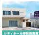
シティホール岸和田南