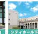
シティホール下松