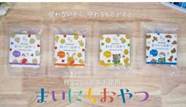
やさしさが評価された「まいにちおやつシリーズ」の画像は、動画コンテストで最優秀賞を受賞した作品のタイトルサムネイルに使用された

今後は、動画コンテストの受賞作品を広報戦略の柱として活用し、都市部のセレクトショップや高級スーパー等への販路拡大を積極的に進め