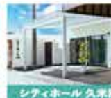
シティホール久米田