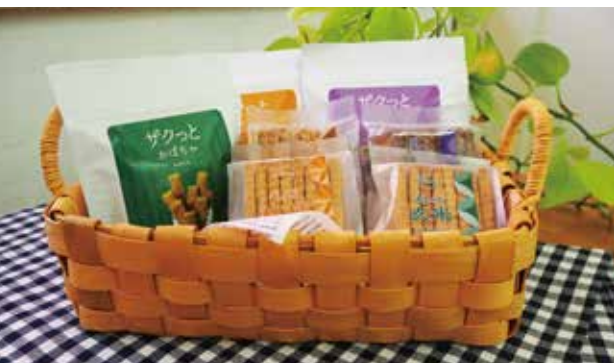
「素材の旨みをぎゅっと閉じ込めたギュッとシリーズ」と「噛むほどに広がる、香ばしい味わいザクッとシリーズ」