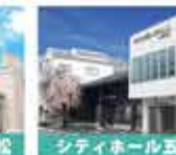
シティホール五軒屋

【担当地域 和泉市・高石市・泉大津市・忠岡町・岸和田市・貝塚市・船取町・泉佐野市・田尻町・泉南市・飯南市・岬町】