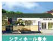
シティホール豊水