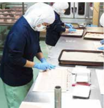
商品はすべて心を込めて手作業で製造されている

力は工場キャパシティの半分程度に止まっており、今後は、需要に応じて倍増できる余地があります。小回りの利く製造体制と成長余力を兼ね備えている点は、同社の大きな強みになっていきます。