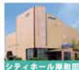
シティホール岸和田