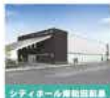
シティホール岸和田新島